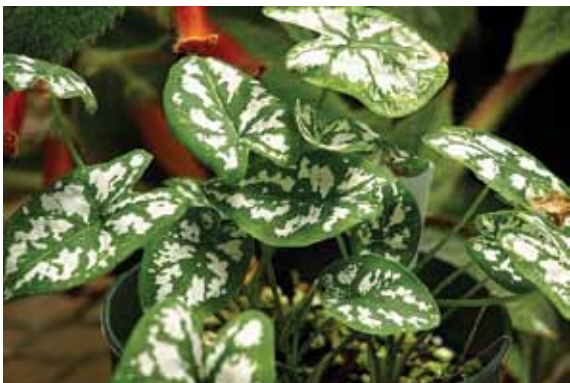
3 pav. Mažasis kaladis ( Caladium humboldtii (Raf.) Schott)

Lem., 3 pav.) – iš Brazilijos introdukuotas 1855 metais ir 1857 m. Paryžiuje pradėtas auginti kaip dekoratyvus augalas (Lecoufle, 1982). Šios rūšies augalai užauga 18-25 cm aukščio, išaugina gausiai tamsiai žalių strėliškai kiaušiniškų lapų. Žinomas vienas porūšis su baltai dėmėtai lapais ir tik viena veislė – Marcel, sukurta audinių kultūros metodu (Lecoufle, 1982). Margasis kaladis ( C. schomburgkii Schott, 4 pav.) paplitęs Brazilijoje. Dėmėtojo kaladžio ( C. picturatum K. Koch et C.D. Bouche) lapalakštis lancetiškai strėliškas (5 pav.). Dvispalvis kaladis ( C. bicolor (Aiton) Vent., 6 pav.) gausiai auga tropiniuose Brazilijos miškuose, taip pat Mažųjų Antilų salose. Išaugina 8-12 cm ilgio mėlynai žalius lapus, išmargintus baltomis ir raudonomis dėmėmis. Ši rūšis į Europą introdukuota 1773 m. (Bailey, 1975). Labai reikšminga botanikams ir selekcininkams. Masiškai auginami hibridinės kilmės puošnieji kaladžiai ( C. x hortulanum Birdsey). Šiai rūšiai priskiriami hibridai, gauti kryžminant įvairias savaimines rūšis bei porūšius. Lapai strėliški, širdiški, įvairaus dydžio bei formos, įvairiausių spalvinių derinių. Puošnieji kaladžiai pagal lapalakščio formą yra skirstomi į 3 grupes: plačialapius, siauralapius ir gofruotus. Gausiausiai auginama plačialapių, kilusių iš C. bicolor ir C. picturatum , tuo tarpu siauralapės, gautos kryžminant C. schomburgkii ir kitas rūšis, yra retesnės (Everett, 1981).