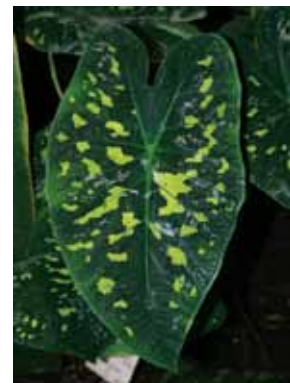
4 pav. Margasis kaladis ( Caladium schomburgkii Schott)