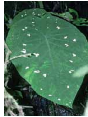
2 pav. Smaragdinis kaladis ( Caladium smaragdinum K.Koch & C.D.Bouché)

Lem., 3 pav.) – iš Brazilijos introdukuotas 1855 metais ir 1857 m. Paryžiuje pradėtas auginti kaip dekoratyvus augalas (Lecoufle, 1982). Šios rūšies augalai užauga 18-25 cm aukščio, išaugina gausiai tamsiai žalių strėliškai kiaušiniškų lapų. Žinomas vienas porūšis su baltai dėmėtai lapais ir tik viena veislė – Marcel, sukurta audinių kultūros metodu (Lecoufle, 1982). Margasis kaladis ( C. schomburgkii Schott, 4 pav.) paplitęs Brazilijoje. Dėmėtojo kaladžio ( C. picturatum K. Koch et C.D. Bouche) lapalakštis lancetiškai strėliškas (5 pav.). Dvispalvis kaladis ( C. bicolor (Aiton) Vent., 6 pav.) gausiai auga tropiniuose Brazilijos miškuose, taip pat Mažųjų Antilų salose. Išaugina 8-12 cm ilgio mėlynai žalius lapus, išmargintus baltomis ir raudonomis dėmėmis. Ši rūšis į Europą introdukuota 1773 m. (Bailey, 1975). Labai reikšminga botanikams ir selekcininkams. Masiškai auginami hibridinės kilmės puošnieji kaladžiai ( C. x hortulanum Birdsey). Šiai rūšiai priskiriami hibridai, gauti kryžminant įvairias savaimines rūšis bei porūšius. Lapai strėliški, širdiški, įvairaus dydžio bei formos, įvairiausių spalvinių derinių. Puošnieji kaladžiai pagal lapalakščio formą yra skirstomi į 3 grupes: plačialapius, siauralapius ir gofruotus. Gausiausiai auginama plačialapių, kilusių iš C. bicolor ir C. picturatum , tuo tarpu siauralapės, gautos kryžminant C. schomburgkii ir kitas rūšis, yra retesnės (Everett, 1981).