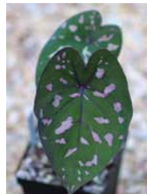
6 pav. Dvispalvis kaladis ( Caladium bicolor (Aiton) Vent.)