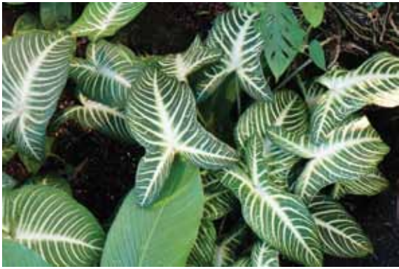
1 pav. Lindeno kaladis ( Caladium lindenii (André) Madison)