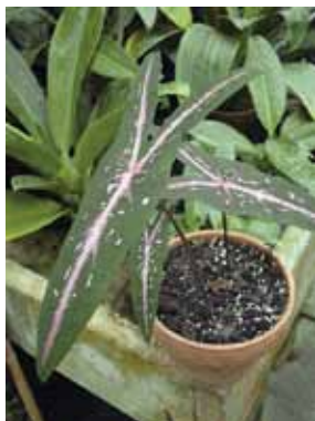
5 pav. Dėmėtasis kaladis Caladium picturatum K.Koch & C.D.Bouché